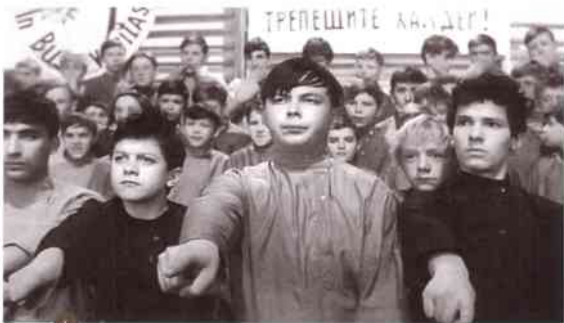
1 Кадр из фильма «Республика ШКИД».

— Тут Ленька, то есть товарищ прокурор, сказал про Земфиру: она не виновна, что полюбила другого. Как это так — не виновна! А зачем она голову морочила Алеко? Лично я не могу уважать таких женщин. Она просто пустышка, Земфира, и поступок этот очень подлый.