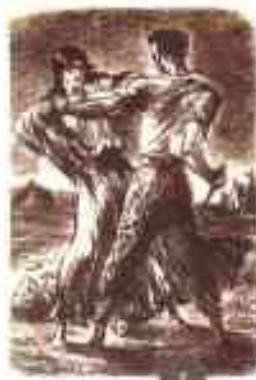
2 К. Клементьева. Сцена убийства Земфиры Алеко. Иллюстрация к поэме А.С. Пушкина «Цыганы». 1936 г.