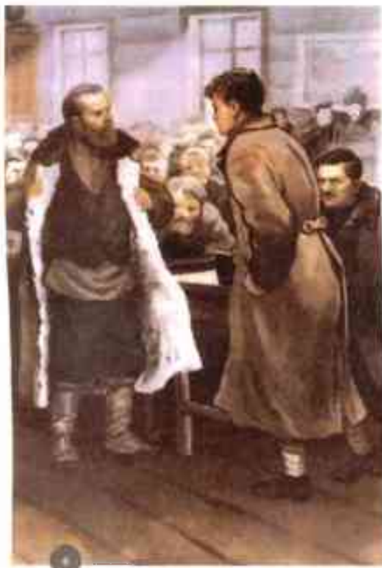
Иллюстрация сцены литературного суда к повести Н. Яценко «Искры не гаснут».

и убедили парня... На голову Феде надели парик-лысину... усики нарисовали черные... В костюмерной нардома подобрали для него старый фрак и цилиндр, в руки дали трость с металлическим набалдашником... На носу кое-как держалось пенсне, вернее, заржавленная оправа без стекол.