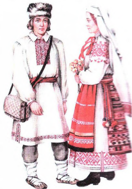
Сямейная пара ў святочным адзенні. XIX стагоддзе

Прафесар падкрэслівае: у традыцыйным беларускім светапоглядзе сумневаў не было. Чалавек павінен стварыць сям'ю, жыць у ёй, нарадзіць і выгадаваць дзяцей, а потым перадаць гэту традыцыю наступнаму пакаленню. А дзеці? Яны былі не толькі працягам роду, але і пераемнікамі, носьбітамі традыцый, тым самым мостам паміж мінулым і будучыняй. Так што калі думаць пра кірмаш, то гэта хутчэй не месца для пакупака, а цэлы рынак лёсаў!