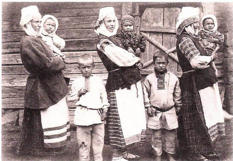
Дзе ў сям'і лад, там дзеці добра гадуюцца. Бабруйскі павет, 1911 год