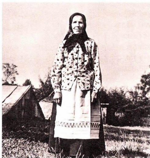
Маці, матуля, матулечка... Любоў да яе ў беларусаў – цэлая філасофія

зноў напаўняюцца, і гульня працягваецца. Выйграць у гэтым атракцыёне лічылася справай гонару, а галоўнае – радасць для каханай.