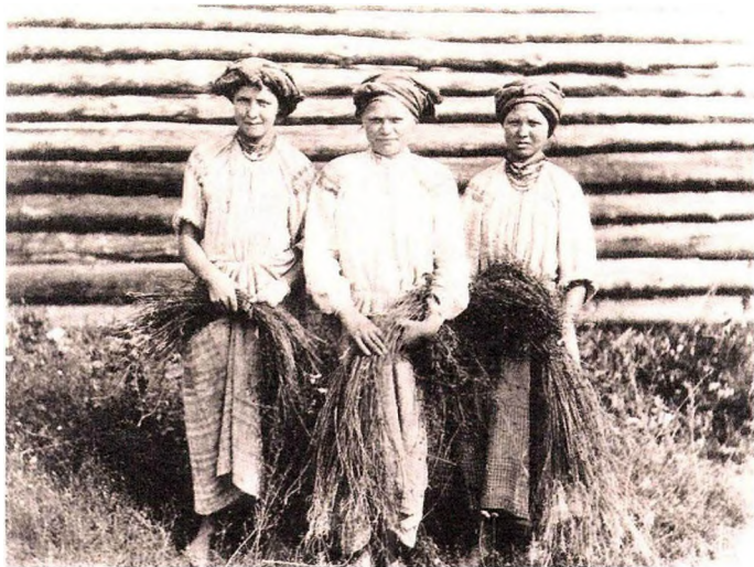
Дзяўчаты лён бралі. Магілёўская губерня, 1903 год