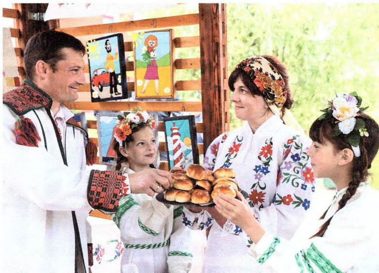
Працавітасць, дабрыва, шчырасць і сёння асноўныя складнікі сямейнага дабрабыту

Нашы продкі, калі бачылі прывабную дзяўчыну, казалі: «Прыгожая, як Ляля». А Ляля, нагадаем, гэта ж багіня Вясны! Але ж, як аказалася, прыгажосць – не галоўнае. Больш цаніліся працавітасць, дабрыва і шчырасць. Бо з тварам да вянца, а з розумам – да канца.