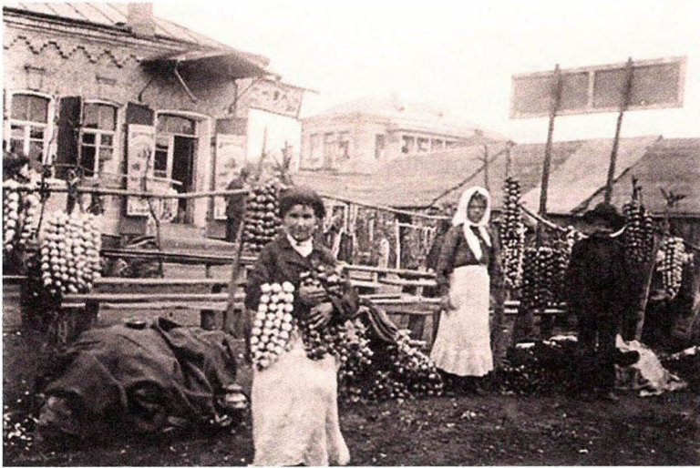
На кірмашы ў Петрыкаве Мазырскага павета. XIX стагоддзе