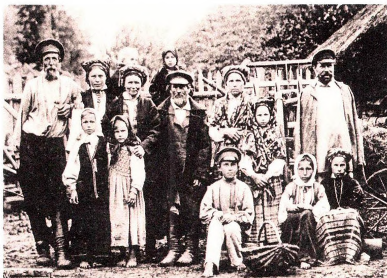
Слуцкія сяляне. Пачатак XX стагоддзя