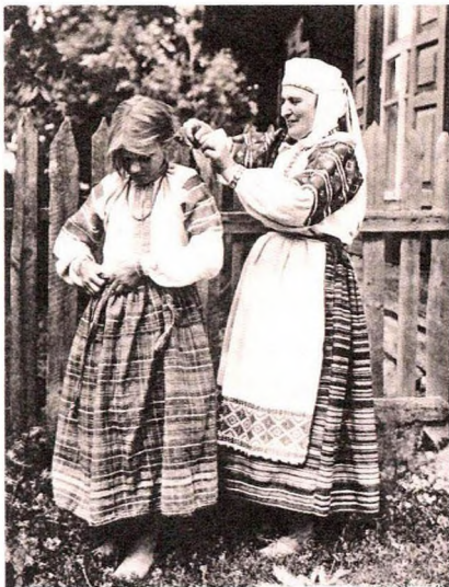
Прыгажосць XIX стагоддзя

Але мы трохі забеглі наперад... Паводле слоў Ірыны Калачовай, раней маладыя людзі часта знаёміліся на кірмашах. Бацькі, якія мелі дарослых сыноў і дачок, абавязкова бралі іх з сабой, бо менавіта там можна было сустрэць сваю палавінку. Народ нават жартаваў: «Глядзі дзевак на кірмашы – можа знойдзеш для душы». І сапраўды, падчас гандлю, агульных спеваў, танцаў