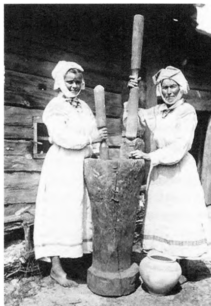
Таўчы ячмень – справа адказная

агародзе». Зразумела, дзеўка, якая на градах шчыруе, – гэта вам не тая, што толькі на танцуючых круціцца!