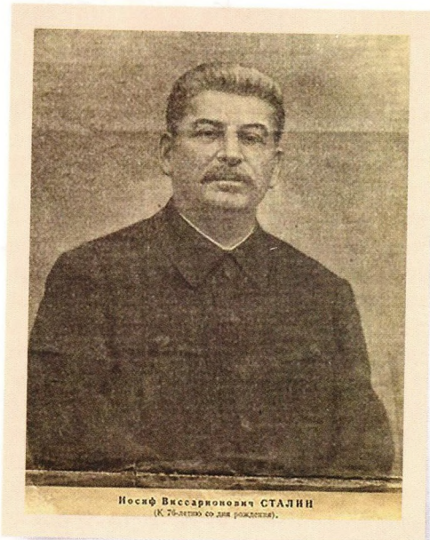
▲ Фото Сталина в газете «Правда». 21 декабря 1955 года

против культа личности. Расхождение у меня с тобой, товарищ Хрущёв, нет. Но есть оттенок. Не намерен вести борьбу против тебя. Предлагаю лишь сформулировать решение, как отметить день рождения Сталина». Дань величию отдать надо, настаивал он. Хрущёв ответил горько: «Кадры перебили. Военных». В конце концов согласились праздновать в прессе, но без помпы.