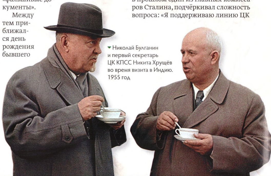
▼ Николай Булганин и первый секретарь ЦК КПСС Никита Хрущёв во время визита в Индию. 1955 год

«главного рулевого» — 21 декабря. На заседании Президиума 5 ноября 1955 года Хрущёв предложил отметить годовщину в прессе, но без торжественных собраний. Сменивший Маленкова на посту председателя совмина Николай Булганин и его первый заместитель Анастас Микоян были «за». Климент Ворошилов и другой заместитель Булганина Лазарь Каганович возражали. Каганович, в прошлом один из главных комиссаров Сталина, подчёркивал сложность вопроса: «Я поддерживаю линию ЦК