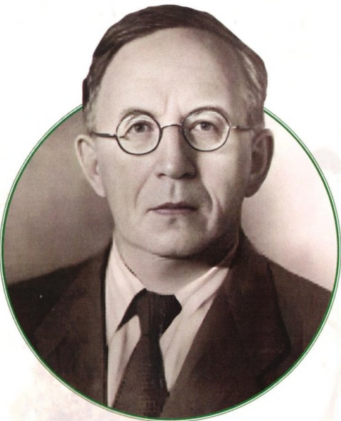
▼ Пётр Николаевич Поспелов, кандидат в члены Президиума ЦК КПСС. 1958 год

18 февраля Хрущёв получил от Поспелова и Аристовой черновик своей антисталинской речи, а 19-го дополнил её своими комментариями. Тогда же текст выступления на 83 страницах раздали другим членам Президиума для поправок и добавлений; работа над ним продолжалась параллельно заседаниям съезда.