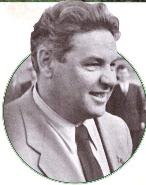
▲ Дмитрий Трофимович Шепилов, 1955 год

Много лет спустя Каганович писал, что решение о «секретном докладе» пришло неожиданно: «Трудно было за короткое время прочесть эту объёмистую тетрадь и обдумать её содержание, чтобы по нормам внутривластной демократии принять решение... предполагалось собрать после XX съезда Пленум ЦК и заслушать доклад комиссии с соответствующими предложениями». Однако, по словам Кагановича, обсуждение затянулось, и поэтому «без какого-либо голосования его свернули и пошли на съезд. Там объявили о дополнении к повестке дня, предложили заслушать доклад Хрущёва о культе личности Сталина».