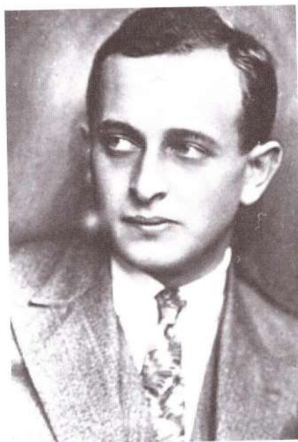
▼ Адольф Эйхман. Фото 1920-х годов

дал, что нет. Его ответы и впрямь свидетельствуют о том, что на всех постах его более всего занимало максимально эффективное и точное выполнение порученного ему задания. Разве без личного отношения к рыбе невозможно стать хорошим рыбаком? Разве рыбак ненавидит рыбу?