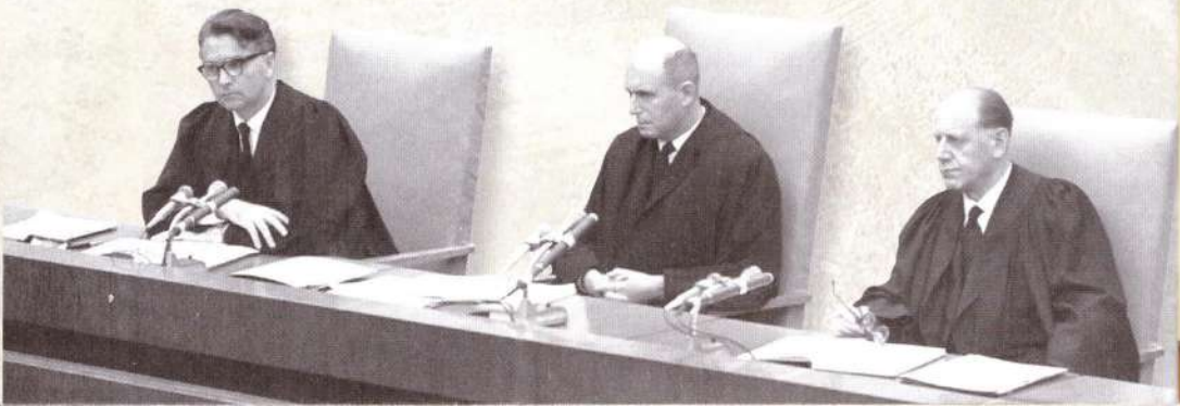
▼ Судьи на процессе. Иерусалим, 1961 год

Прокурору облегчало задачу то, что Нюрнбергский процесс уже назвал преступными организации, видным сотрудником которых был оберштурмбаннфюрер — СС, СД и гестапо, — и установил факт целенаправленного уничтожения миллионов людей по национальному признаку. Но судьи в Нюрнберге имели дело в основном с документами; в Иерусалиме перед судом дали показания более ста свидетелей. Они были выходцами из самых разных европейских стран, и это подчёркивало масштабы учинённого геноцида. Их рассказы предъявляли всему миру ужасающие