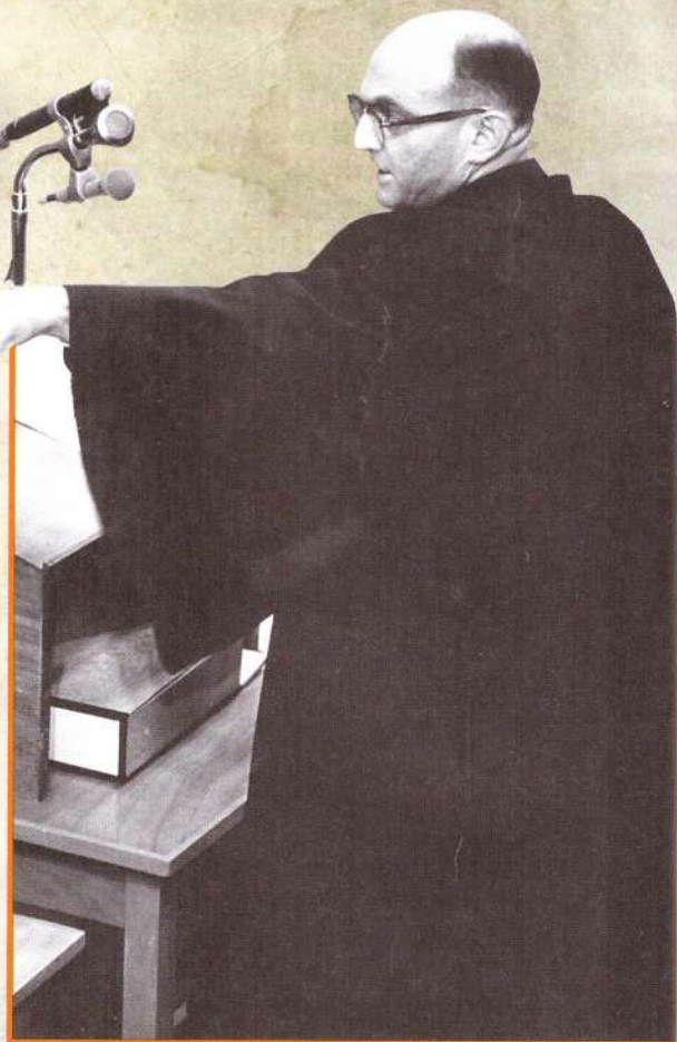
▲ Обвинитель Гидеон Хауснер. Иерусалим, 1961 год

«Не один я предъявляю сейчас обвинения Адольфу Эйхману, со мной — ещё шесть миллионов обвинителей». Главный его тезис заключался в том, что Эйхман был не просто винтиком системы, но и ответственным лицом, которое прилагало все усилия к тому, чтобы максимально эффективно выполнить возложенные на него чудовищные задачи.