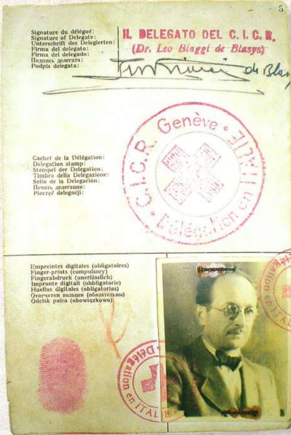
▲ Удостоверение Красного Креста на имя Рикардо Клемента, по которому Эйхман перебрался в Аргентину. 1950 год