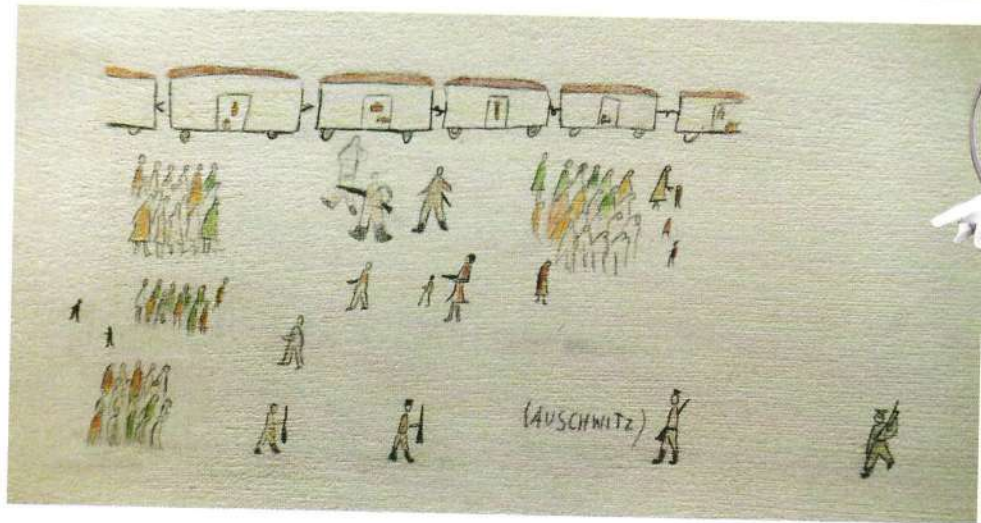
▲ Аушвиц. Рисунок заключённого ребёнка, хранится в музее, созданном на территории бывшего концентрационного лагеря Аушвиц-Биркенау

что железная дорога порой задерживала подачу заказанных составов и вместо 700 человек в эшелон, идущий в Аушвиц, приходилось записывать тысячу — ведь это было нарушением циркуляра! Он досадовал на то, что «ответственные на местах» не проводили при отправке «селекцию», не отделяли трудоспособных от детей, стариков и инвалидов; «эти ребята сгоняли всех в одну кучу», как он выразился. У читающего сегодня протоколы его допросов на предварительном следствии не может не возникнуть ощущения, что речь идёт о расследовании каких-то хозяйственных преступлений, например, хищений товара с овощебазы: накладные, вагоны, качество материала... Человеческого материала. Всё время кажется, что вот-вот прозвучит нечто вроде «усушки» или «пересортицы».