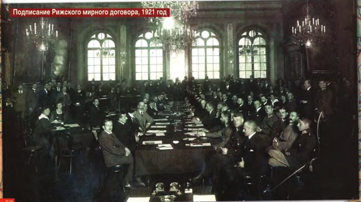
Подписание Рижского мирного договора, 1921 год

В принципе, условия устраивали и Польшу, и Россию. Ян Домбский вспоминал, что по возвращении домой его делегацию на каждой крупной станции встречали с почетными караулами и оркестрами. Доволен был и Иоффе: переговоры в Риге позволили разгромить последний оплот белых – Крым – и завершить Гражданскую войну в европейской части бывшей империи. Пострадали только белорусы с украинцами – они оказались разделенными народами. Но последние хотя бы могли утешать себя тем, что участвовали в переговорах. К тому же Украина в процентном соотношении потеряла меньше территории и населения, чем Беларусь. Это понимали и в БССР, и в эмигрантских кругах. Правительство БНР в третью годовщину провозглашения независимости, 25 марта 1921-го, назвало Рижский мир позором и «кошмарной насмешкой над демократией». А белорусские эсеры в обращении к польским социалистам писали, что договор не вечен, и западные