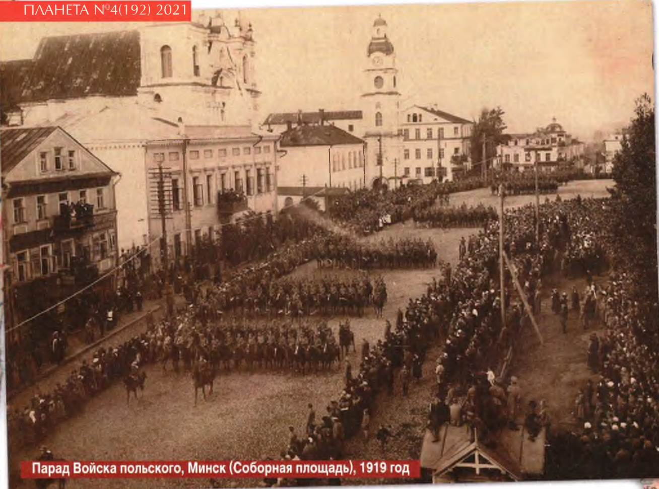
Парад Войска польского, Минск (Соборная площадь), 1919 год

Да и в Москве мечтали о мировой революции, что было невозможно без похода на запад – как минимум до Германии.