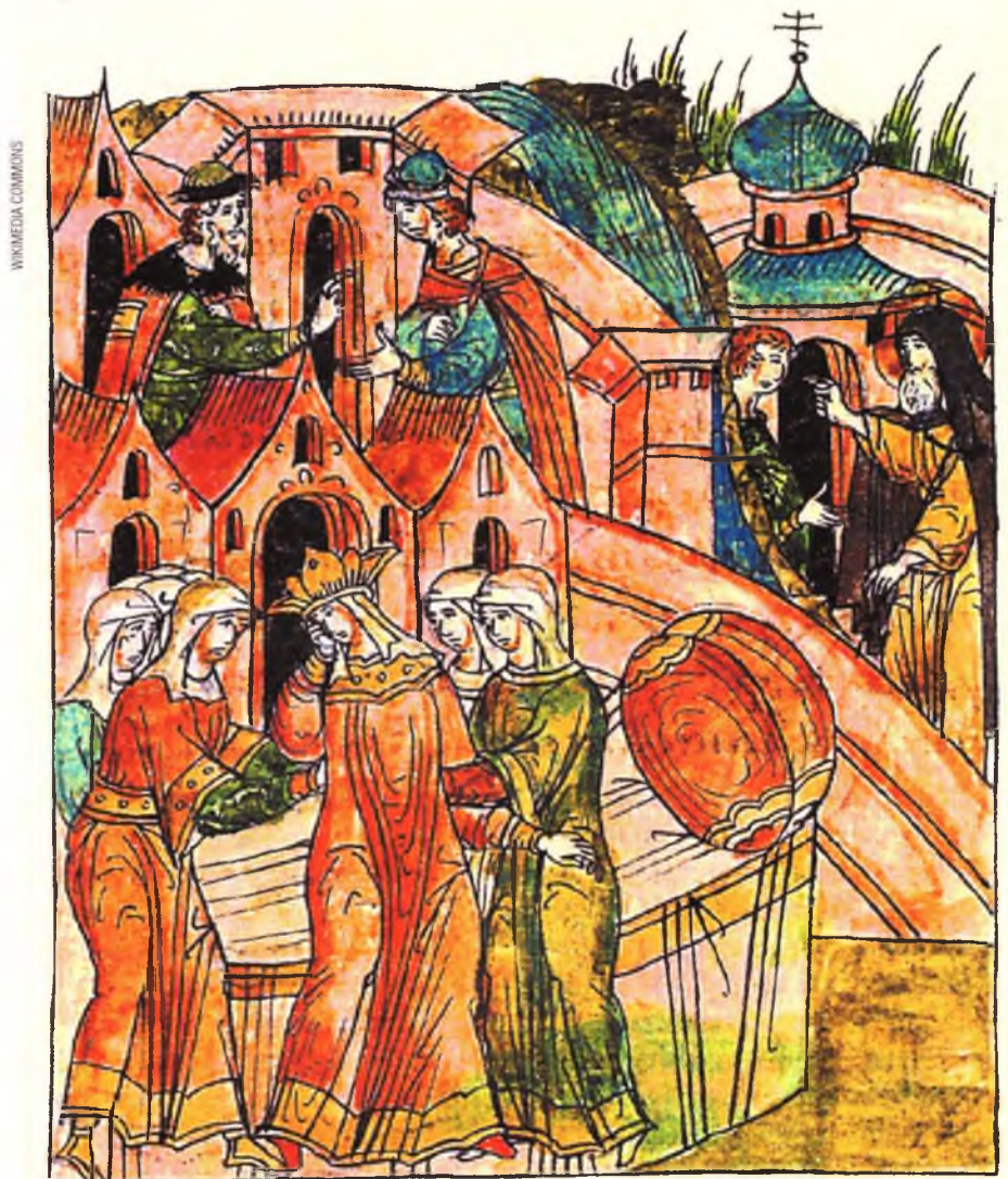
Нараджэнне Васіля II. Мініяцюра з «Ліцавога зводу». Летапіс сведчыць, што роды былі цяжкія.

Успомнім, што нават польскі гісторык Ян Длугаш, які высока цаніў Вітаўта, крытыкаваў яго за тое, што мог кінуць войска ў паходзе ды памчацца да каханкі. А паводле блытанага аповеду Герберштэйна, Васіль I падазраваў Соф'ю ў здрадзе. Падобныя падазрэнні і абвінавачванні не былі чымсьці вынятковым: у шлюбнай нявернасці вінавацілі апошняю Ягайлаву жонку Соф'ю