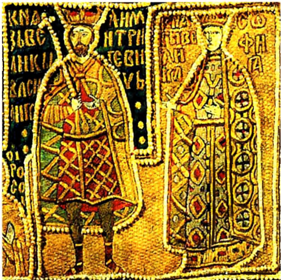
Соф'я і Васіль I. Вышыўка 1414–1417 гадоў.

давала не толькі тэрыторыі і іх рэсурсы, але і прэстыж. Князь, які яго меў, лічыўся старшым сярод іншых князёў паўночна-ўсходняй Русі. Да мангольскага нашэсця падобны статус на Русі давала валоданне Кіевам. Ярлык (дазвол) на вялікае княжанне Уладзімірскае даваў рускім князям хан Залатой Арды.