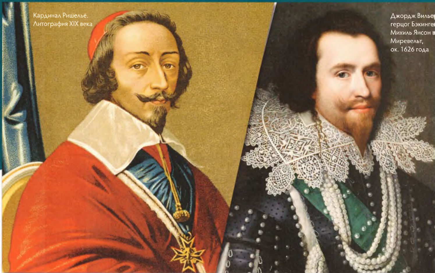
Джордж Вильерс, герцог Бэкингема, Михиль Янсон ван Миревельт, ок. 1626 года