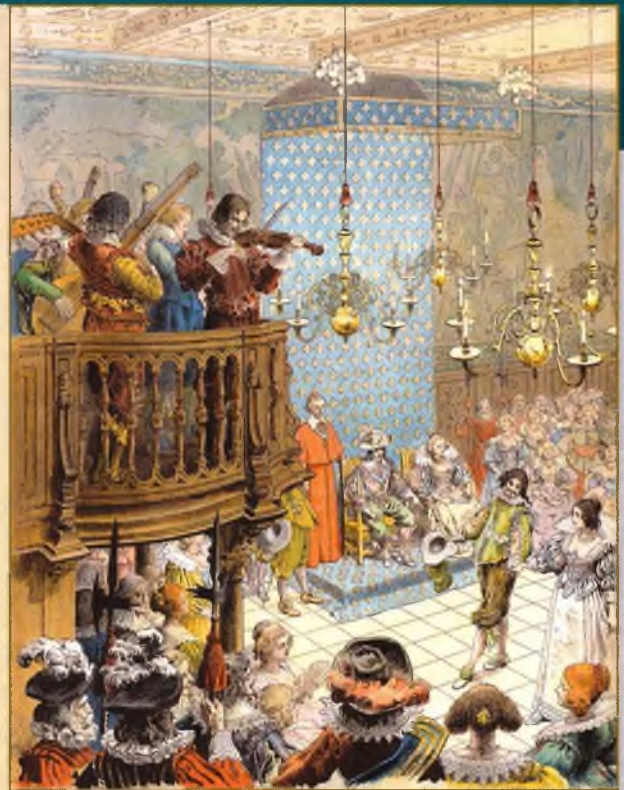
▲ Бал при дворе короля Людовика XIII. Морис Лелуар, 1894 год

и большую часть жизни провёл в физических страданиях. Но это не помешало ему заложить основы того великого государства, которое потом достроил Людовик XIV. А Дюма ещё загладил вину. Через 20 лет после «Трёх мушкетёров» он написал роман «Красный сфинкс», где кардинал уже предстал перед читателем во всём великолепии. Жаль, что при жизни Дюма роман так и не вышел. ▼