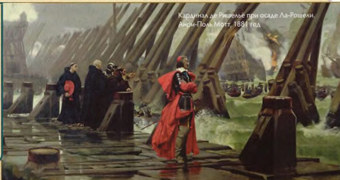
Кардинал де Ришельё при осаде Ла-Рошели. Анри-Поль Мотт, 1881 год

Одно из главных достижений Ришельё — создание флота. В первой половине XVII века французский флот находился в плачевном состоянии. Вельможи, носившие звание адмиралов, отвечали за береговую охрану и работу маяков. Между тем Испания, Голландия и Англия боролись за господство на море и всю осваивали Новый Свет. Кардинал убедил Людовика XIII в том, что флот Франции жизненно необходим. К концу XVII века Франция имела один из самых развитых флотов в Европе и несколько колоний в Вест-Индии.