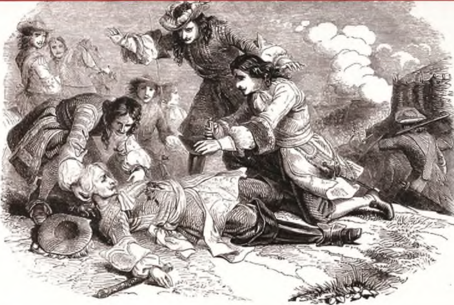
▲ Смерть д'Артаньяна при осаде Маастрихта. Гравюра XIX века