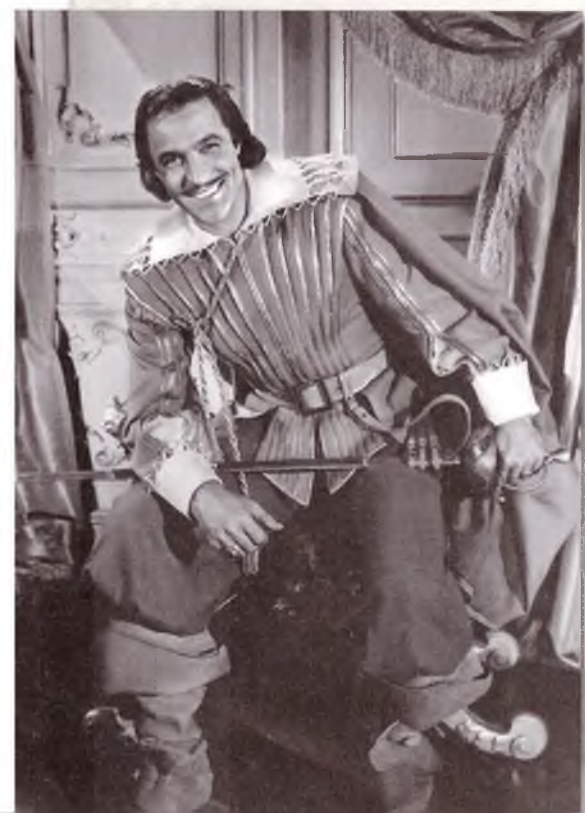
▲ Джин Келли в роли д'Артаньяна в фильме «Три мушкетёра», США, 1948 год

Король поручил ему охрану арестованного им же Фуке в неприступной крепости Пиньероль (д'Артаньян вроде бы опять протестовал: мол, не дело мушкетёру быть тюремщиком, но несколько лет исправно им работал). А в 1665-м д'Артаньяна назначили заведующим королевским птичьим двором. Впервые за долгое время гасконец получил неплохой, а главное, стабильный доход. Именно тогда он начал именовать себя графом. Потом этот титул пытались оспаривать, детям д'Артаньяна даже пришлось за него судиться, и Людовик XIV в результате пошёл им навстречу.