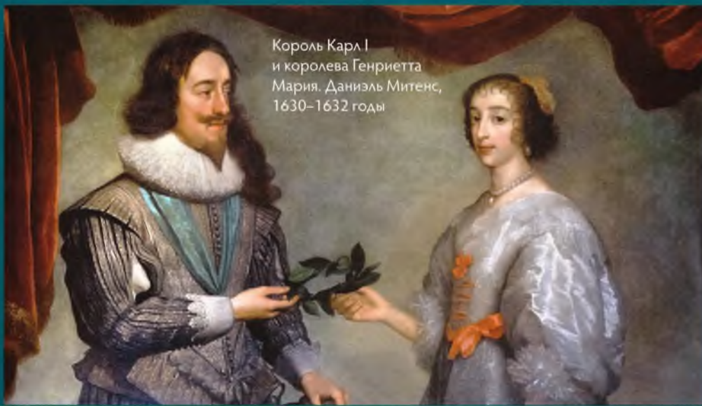
Король Карл I и королева Генриетта Мария. Даниэль Митенс, 1630–1632 годы

В 1625 году Бэкингем чуть не попал в опалу из-за провальной экспедиции английского флота на испанский Кадис. Операция, известная как «пьяный рейд», была отвратительно подготовлена. Войска отправились в путь с испорченным провиантом, а на подходах к городу высадившиеся солдаты наткнулись на запасы испанского хереса. Голодные солдаты перепились и не смогли пойти на штурм. Испанцы успели получить подкрепление, англичане рисковали попасть в окружение. В результате флот ушёл обратно в Англию, потеряв 3000 человек и 30 кораблей из 99. Парламент жаждал крови Бэкингема, как инициатора операции, но Карл I его отстоял.