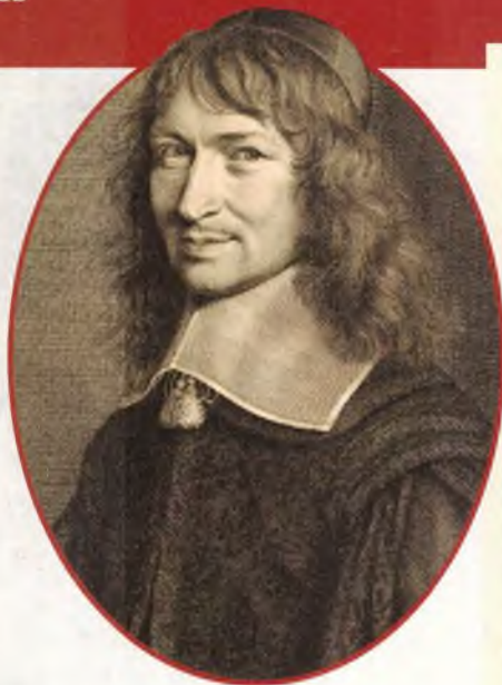
▲ Николая Фуке. Гравюра, 1661 год

Людовик XIV при регентстве матери, Анны Австрийской. Многими государственными делами занимается кардинал Мазарини, он пытается отобрать у де Тревиля мушкетёрскую роту для своего родственника, а когда это не получается, упраздняет её, объясняя это нехваткой средств. То ли ещё до этого, то ли сразу после д'Артаньян становится доверенным курьером при кардинале. То есть кем-то вроде Рошфора при Ришельё — только Мазарини, в отличие от предшественника, платит довольно скупо.