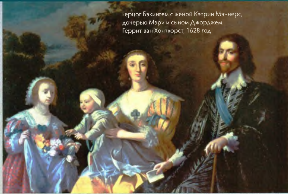
Герцог Бэкингем с женой Кэтрин Мэннерс, дочь Мэри и сыном Джорджем. Геррит ван Хонтхорст, 1628 год

Король заметил Джорджа Вильерса, когда тому был 21 год. Яков увлёкся,