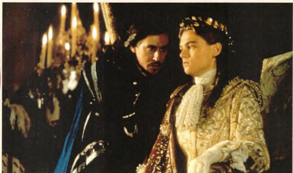
▲ Гэбриел Бирн в роли д'Артаньяна и Леонардо Ди Каприо в роли Людовика XIV в фильме «Человек в железной маске», США, 1998 год

Людовик XIV при регентстве матери, Анны Австрийской. Многими государственными делами занимается кардинал Мазарини, он пытается отобрать у де Тревиля мушкетёрскую роту для своего родственника, а когда это не получается, упраздняет её, объясняя это нехваткой средств. То ли ещё до этого, то ли сразу после д'Артаньян становится доверенным курьером при кардинале. То есть кем-то вроде Рошфора при Ришельё — только Мазарини, в отличие от предшественника, платит довольно скупо.