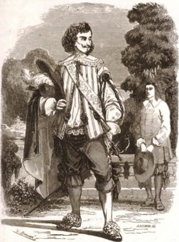
▲ д'Артаньян. Гравюра к французскому изданию романа 1849 года