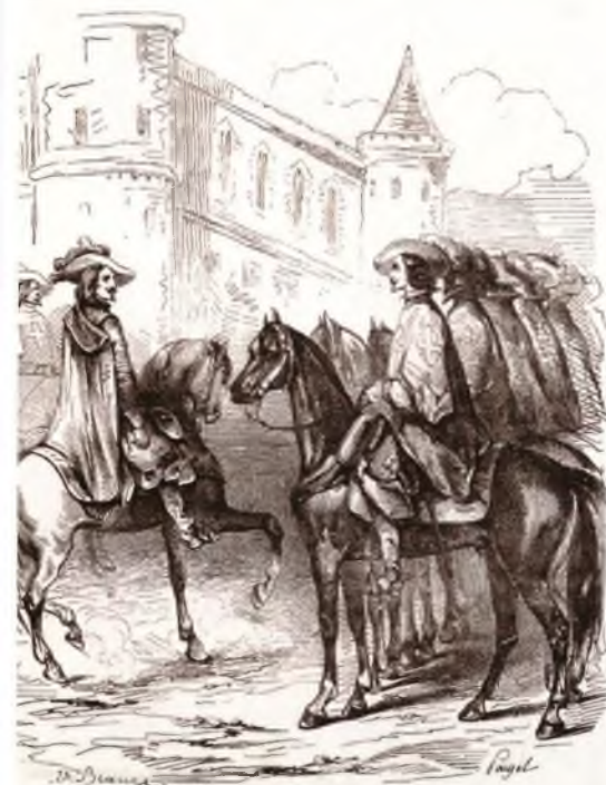
▲ Людовик XIII проводит смотр мушкетёров. Гравюра к французскому изданию романа 1853 года

Гасьен де Куртиль де Сандра не был совсем уж стопроцентным выдумщиком. Мушкетёрскую жизнь он знал не понаслышке — де Куртиль сам был королевским мушкетёром. Писать он начал ещё на службе, а после увольнения в 1688 году целиком отдался творчеству. Его авантюрные романы и вымышленные мемуары пользовались большой популярностью у читателей. Правда, король Людовик XIV в число этих благодарных читателей не входил и дважды сажал де Куртиля за оскорбление королевской семьи в Бастилию — каждый раз на несколько лет. По одной из версий, именно в ходе первого срока писатель получил начальные сведения для «мемуаров» д'Артаньяна — директором Бастилии тогда был господин де Бемо, близкий друг реального Шарля д'Артаньяна.