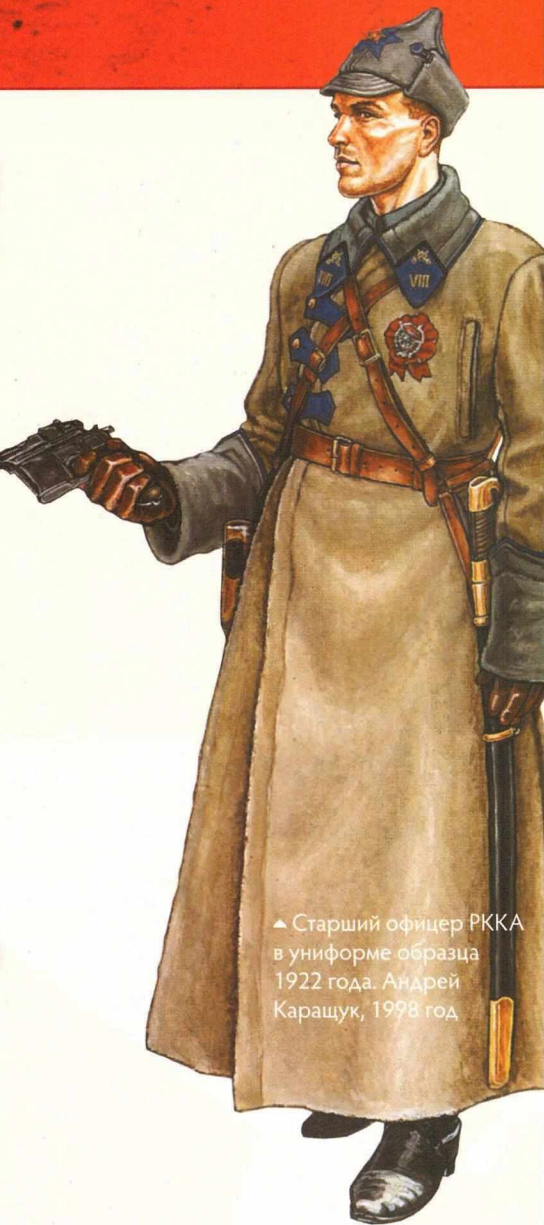
▲ Старший офицер РККА в униформе образца 1922 года.

С января до марта 1919 года Тухачевский командовал 8-й армией Южного фронта, откуда был срочно перебросен на восток, против Колчака. В апреле и мае Тухачевский, командуя 5-й армией, смог перевести отступление в наступление. В июне его армия вышла к Южному Уралу. Потом были Златоустовская и Челябинская операции, в которых Тухачевский взял реванш у Каппеля. Все попытки белых переломить ход кампании, несмотря на локальные успехи,