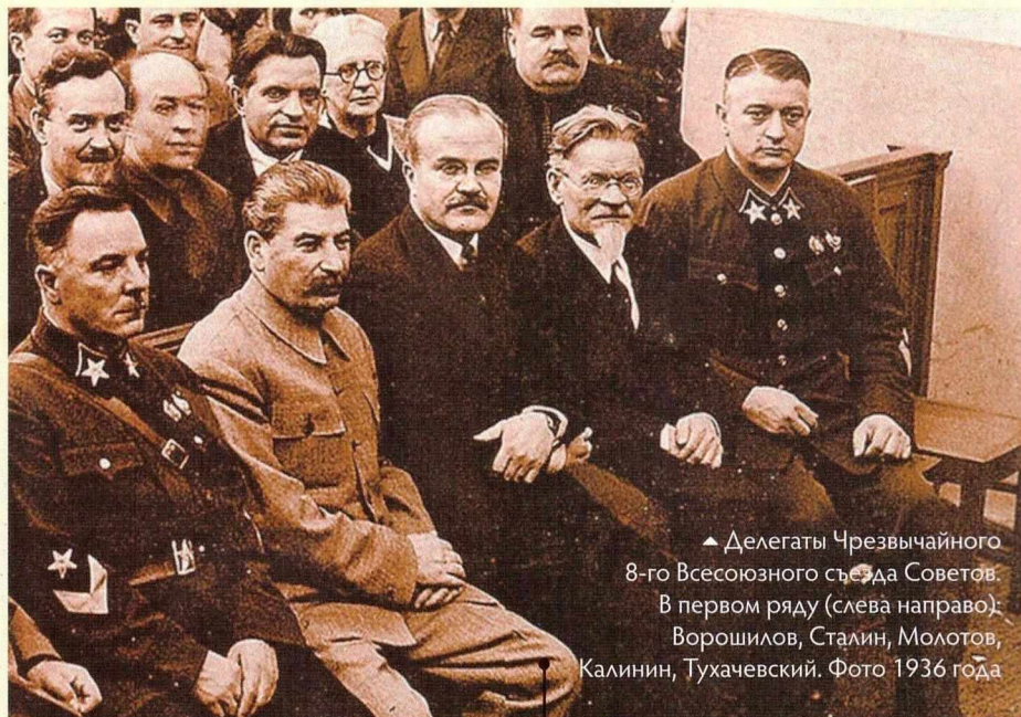
▲ Делегаты Чрезвычайного 8-го Всесоюзного съезда Советов. В первом ряду (слева направо): Ворошилов, Сталин, Молотов, Калинин, Тухачевский. Фото 1936 года