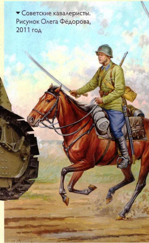
▼ Советские кавалеристы. Рисунок Олега Фёдорова, 2011 год

Усиленные части красных разбили основные повстанческие силы, и крестьяне перешли к партизанской войне. Тухачевский неоднократно заявлял о необходимости применения против их укрытий газового оружия — тогда ещё конвенционального. Но было лишь несколько случаев использования газовых снарядов. Это не дало значимого результата. Гораздо эффективней оказалась традиционная карательная мера — массовое взятие заложников и их казни.