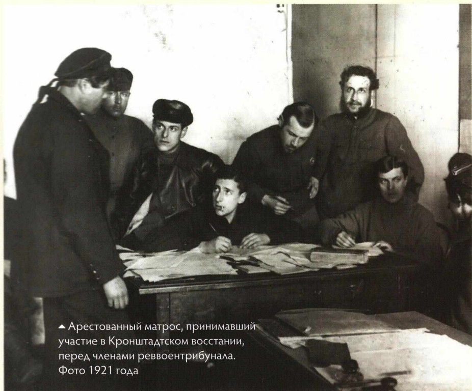
▲ Арестованный матрос, принимавший участие в Кронштадтском восстании, перед членами реввоен трибунала. Фото 1921 года

С точки зрения традиционной карьеры это был провал. С политической — везение. Молодому офицеру не пришлось определять свою позицию ни в дни Февральской революции, ни во время Корниловского мятежа. Михаил Тухачевский возобновил карьеру уже в другой стране и «с чистого листа».