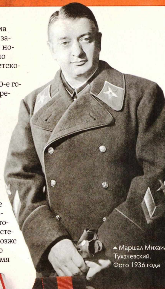
▲ Маршал Михаил Тухачевский. Фото 1936 года

осмыслила роль танковых войск в современной войне. Прежде танк считался средством прорыва обороны, проводником и щитом пехоты. Согласно теории «глубокого боя», разработанной Тухачевским, танковые подразделения должны были проникать глубоко в тыл врага, уничтожая штабы и резервы. В какой-то степени это были идеи блицкрига, позже усовершенствованного и успешно практикуемого вермахтом во время Второй мировой войны.