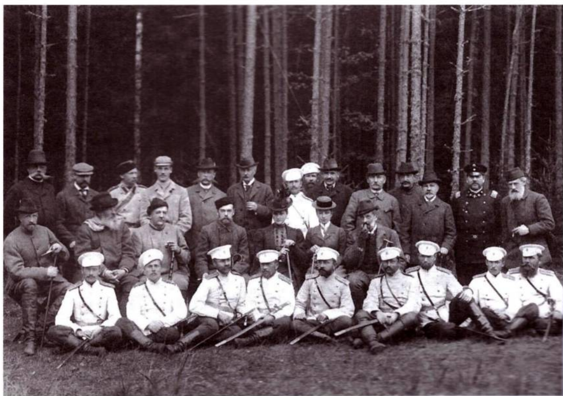
Николай II на охоте в Беловежской пуще