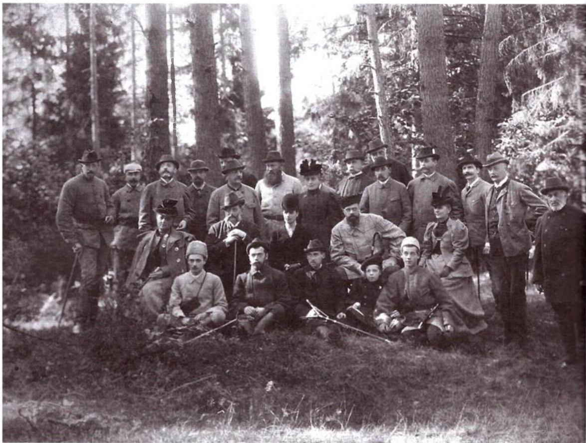
Царская охота Александра III в Беловежской пуше

Издание знакомит с современным (на тот момент) положением государевых охотничьих угодий и в первую очередь — с Беловежской Пушей, ее богатой природой и фауной, хозяйством и жизнью! В разделе «Фауна Пущи» главное внимание уделено описанию зубра, крупнейшему представителю беловежской фауны. Отдельной главой в книге выделен обзор Пущи с точки зрения туриста: