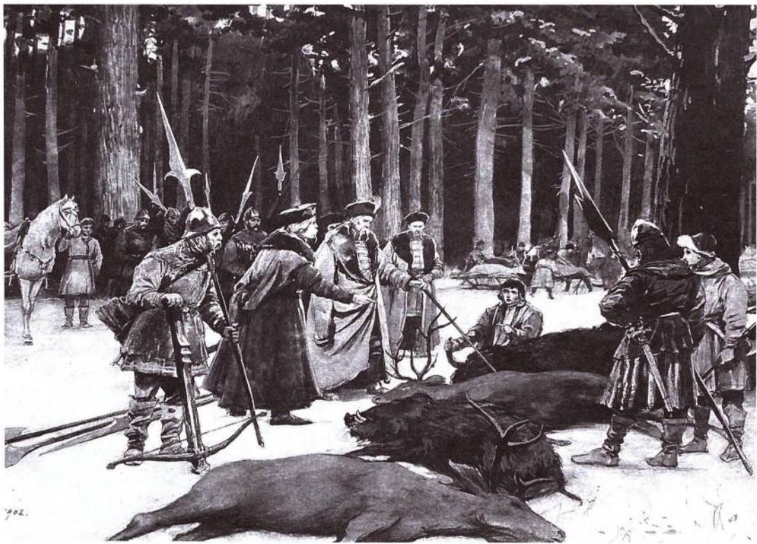
После охоты в Беловежской пуще в 1409 году. 1903 год. Художник В. И. Навозов