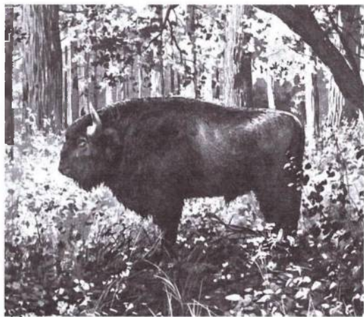
Трехлетний зубр.

го издания, помимо М.А. Зичи, были приглашены лучшие иллюстраторы и художники России (их имена указаны на титульном листе). Таким обра-