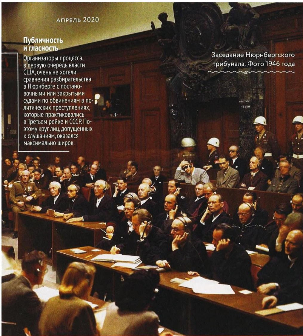
Заседание Нюрнбергского трибунала. Фото 1946 года

ных судов. Поэтому трибунал крайне корректно отнёсся к составлению этого своеобразного чёрного списка потенциальных обвиняемых.