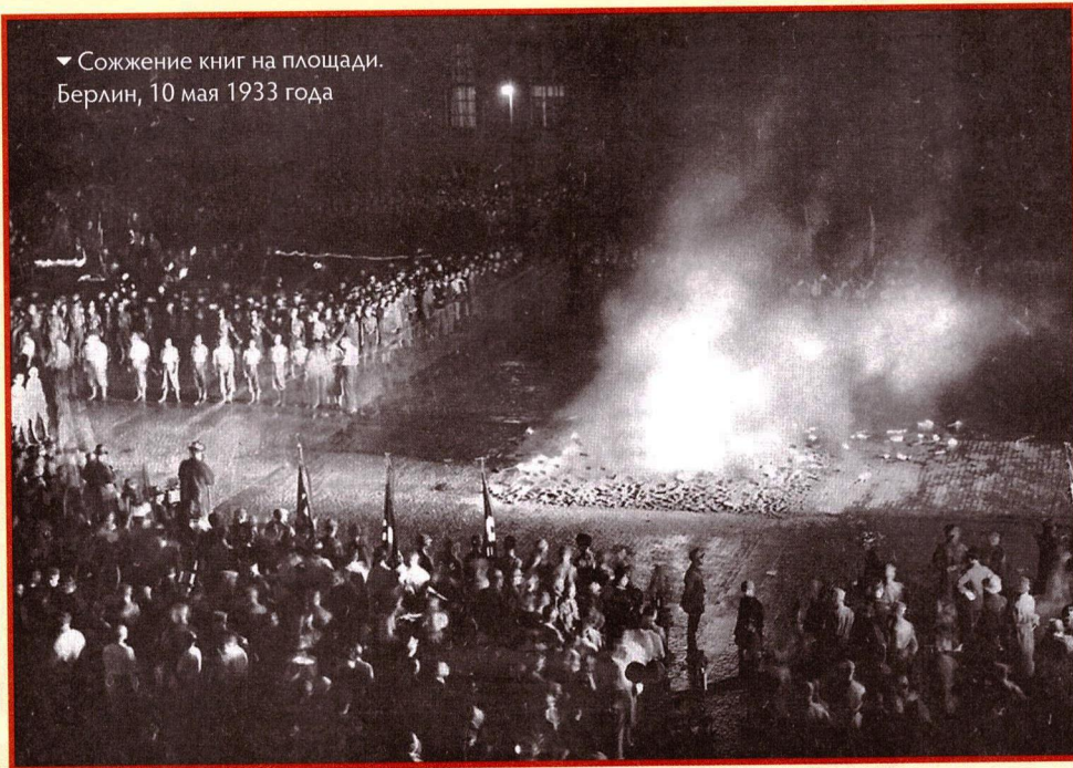
▼ Сожжение книг на площади. Берлин, 10 мая 1933 года

история фальсифицировалась до нелепости: Христос был объявлен «арийцем», а средневековая Священная Римская империя германской нации — предтечей нацистского Третьего рейха. Расовые науки, провозглашавшие немцев высшей расой и клеймившие евреев как источник всех зол на земле, были ещё более смехотворны. В одном только Берлинском университете новый ректор, в прошлом штурмовик, по профессии ветеринар, учредил 25 новых курсов по расовой науке, а ко времени, когда он, по существу, развалил университет, в нём велось преподавание 86 курсов, связанных с его профессией.