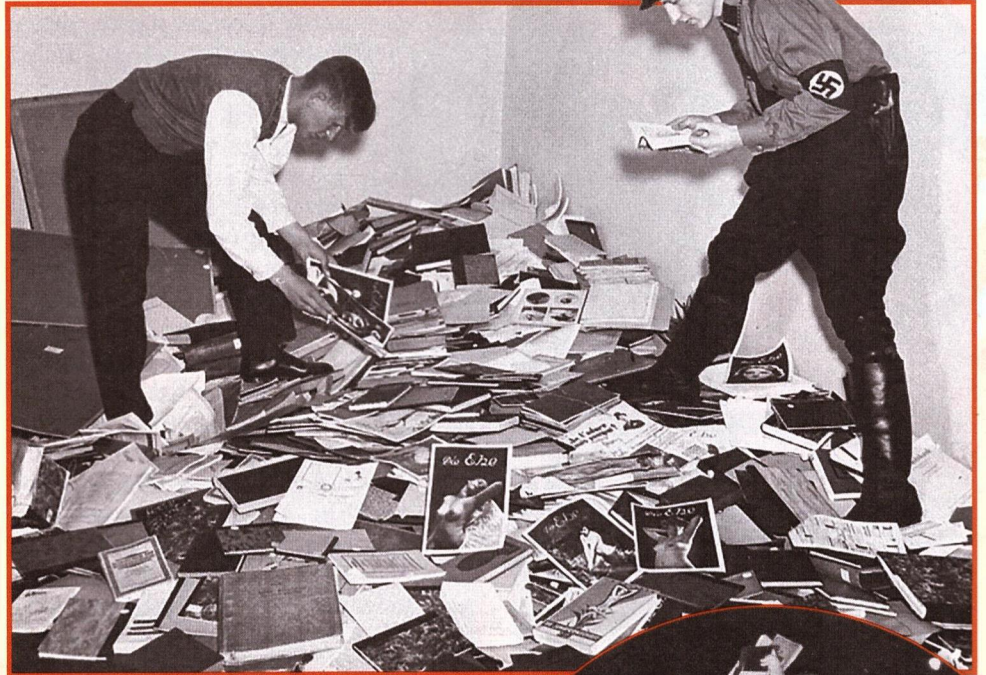
▲ Нацисты отбирают книги для уничтожения в разгромленной библиотеке института сексуальных исследований. Берлин, 6 мая 1933 года

Начиная с 26 апреля 1933 года в рейхе происходил повсеместный сбор книг для сожжения на основании чёрных списков, составленных 29-летним берлинским библиотекарем, членом нацистской партии Вольфгангом Херманом по заданию