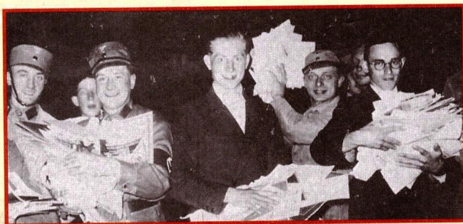
◀ Немцы с книгами, предназначенными для сожжения. Берлин, 10 мая 1933 года