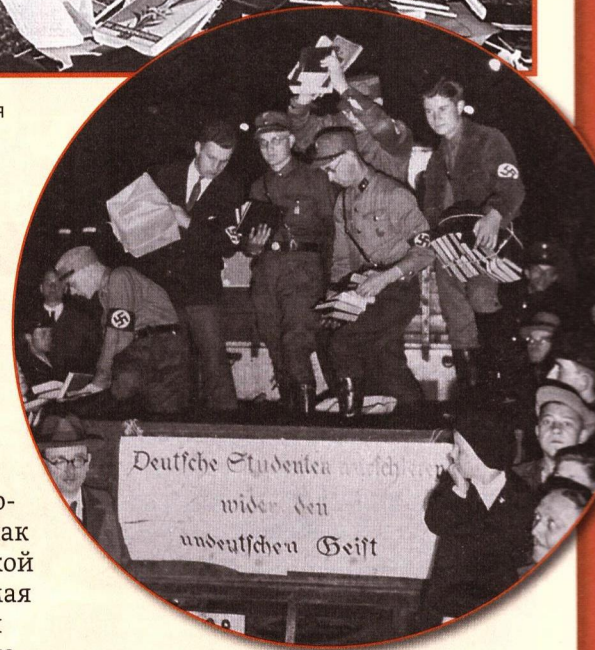
▲ Грузовик с книгами, предназначенными для сожжения. Берлин, 10 мая 1933 года

торам акций на местах позволялось произвольно расширять списки сжигаемых книг. Циркуляр также содержал «обязательный» список из пятнадцати авторов: Георг Бернгард, Теодор Вольф, Эрнст Глезер, Карл Каутский, Альфред Керр, Эрих Кестнер, Эмиль Людвиг, Генрих Манн, Карл Маркс, Карл фон Осецкий, Эрих Мария Ремарк, Курт Тухольский, Фридрих Вильгельм Фёрстер, Зигмунд Фрейд и Вернер Хегеман.